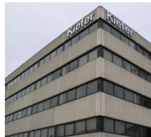
Le bâtiment de la Gg. Kiefer GmbH.