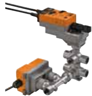
Druckunabhängiges 6-Weg-Zonenventil EPIV

Äusserst platzsparende Zonenlösungen, intelligente Volumenstromregler sowie präzise Sensoren von Belimo regeln das Klima in Einzelräumen und Zonen individuell und energiesparend. So fühlen sich die Menschen wohl, teure technische Einrichtungen werden geschützt und die Betriebskosten gesenkt.