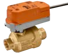
Druckunabhängiges Zonenventil PIQCV