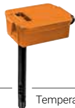
Temperatur- & Feuchtesensor

Mit seinem breiten Produktsortiment deckt Belimo praktisch sämtliche Anwendungen in Luftaufbereitungsanlagen ab. Die Geräte lassen sich genau aufeinander abstimmen und auch in übergeordneten Systemen bedienen, ansteuern und kontrollieren. Das erhöht die Betriebssicherheit und senkt die Unterhaltskosten.