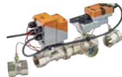
3-Weg-Belimo Energy Valve™

Die einzigartigen 2- und 3-Weg-Ventile sorgen im Zusammenspiel mit dem revolutionären Belimo Energy Valve™ und passenden Sensoren für ausbalancierte und energiesparende Wasserkreisläufe in Gebäuden. Die neue 3-Weg-Drosselklappe mit wählbarer, gleichprozentiger oder linearer Kennlinie kann entweder zum Mischen oder zum Verteilen eingesetzt werden.