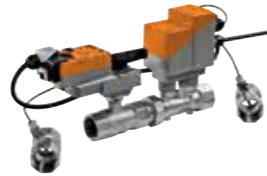
Belimo Energy Valve™